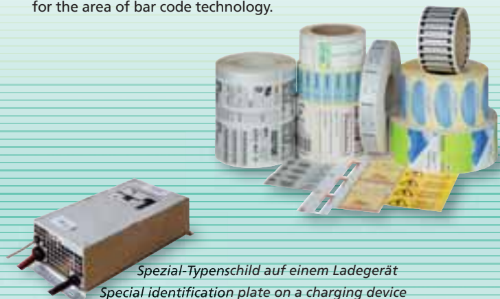
Spezial-Typenschild auf einem Ladegerät Special identification plate on a charging device

SYSTEM PRINT delivers every imaginable type of adhesive label with all kinds of different adhesives, board and plastic tags either blank or printed. Even more – you can also get all hardware components as printing and application systems and all consumables for the area of bar code technology.