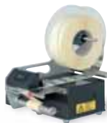
Etikettenspender HES 140 Label dispenser HES 140

The production of customised “special identification plates” is a particular SYSTEM PRINT strong point.