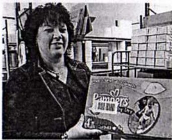
Der Barcode-Aufkleber auf der Pampers-Packung stammt aus Dingden.

In Zeiten von Produkthaftung und -verfolgung hat die Etikettenproduktion Konjunktur. „Überall muss ein Etikett drauf“, sagt Hitpaß.